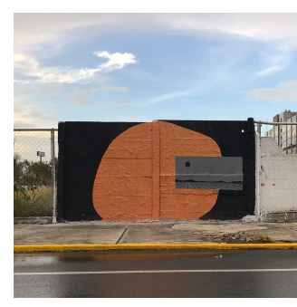
// BLOG BLAST PRESENTA "CUERPOS EN TRÁNSITO I" EN LA CRESTA, MÉXICO