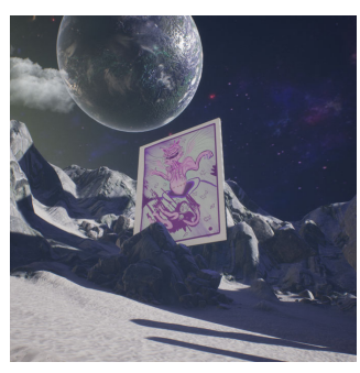
// BLOG ISRAEL URMEER EN BASURA ESPACIAL / SPACE JUNK, PRESENTADO POR DESLAVE