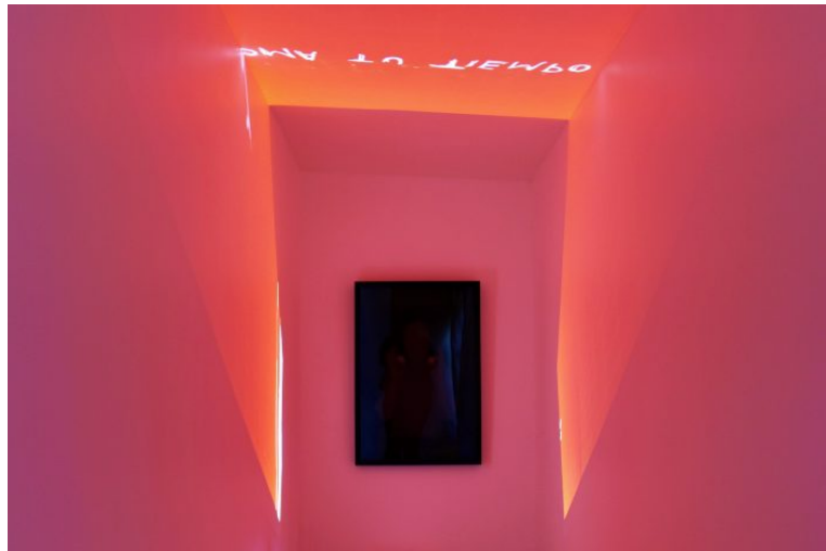
Aldo Guerra, Cámara oscura (2019). Tinta serigráfica sobre vidrio en planos seriados y proyección monocanal.

Fortis | Lozano, Tijuana, Baja California, México 9 de noviembre de 2019 – 7 de diciembre de 2019