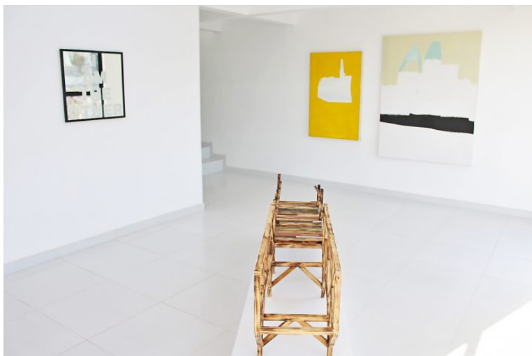
Marcos Ramírez ERRE, I am the other (2019), texto grabado sobre espejo; Burned bridges (2019), maqueta de madera flameada; Enrique Ciapara, Sin título (paisaje amarillo) (2017), acrílico sobre tela; Sin título (montaña blanca) (2018), acrílico sobre tela.